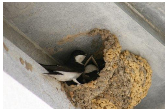
Photo Hirondelles de Fenêtre