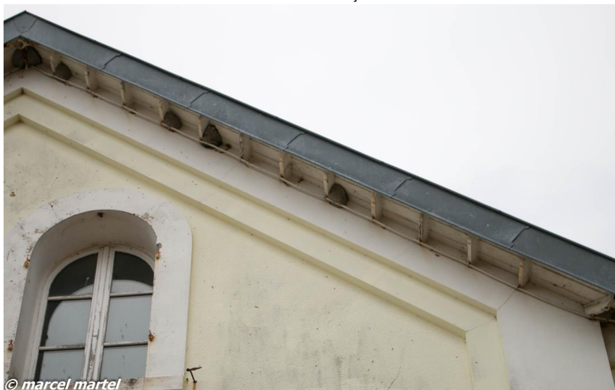
Côté droit de la façade